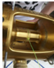
Niet vergeten vast te knopen...