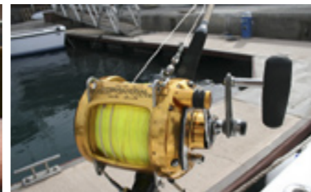
Robuust en betrouwbaar materiaal aan boord is van groot belang!