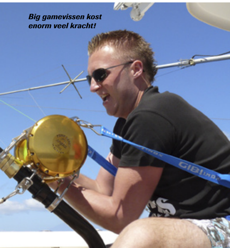
Big gamevissen kost enorm veel kracht!