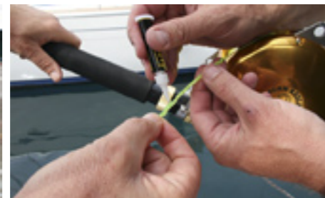
De speciale knopen worden voor de zekerheid nog verlijmd.