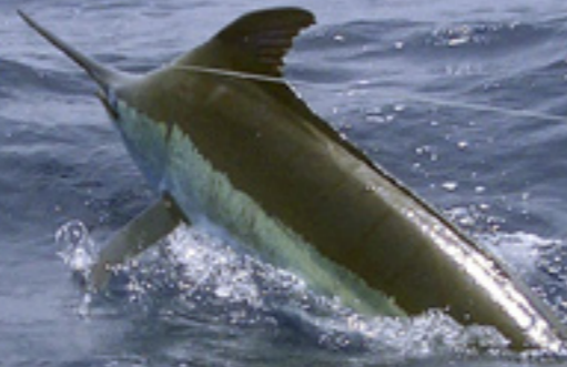
The one that got away...

tonijn kon helaas niet meer ongeschonden worden teruggezet; hij is aan de plaatselijke bevolking gedoneerd, waardoor er weer vele monden gevoed konden worden met deze zeer smakelijke en gezonde zeevis.