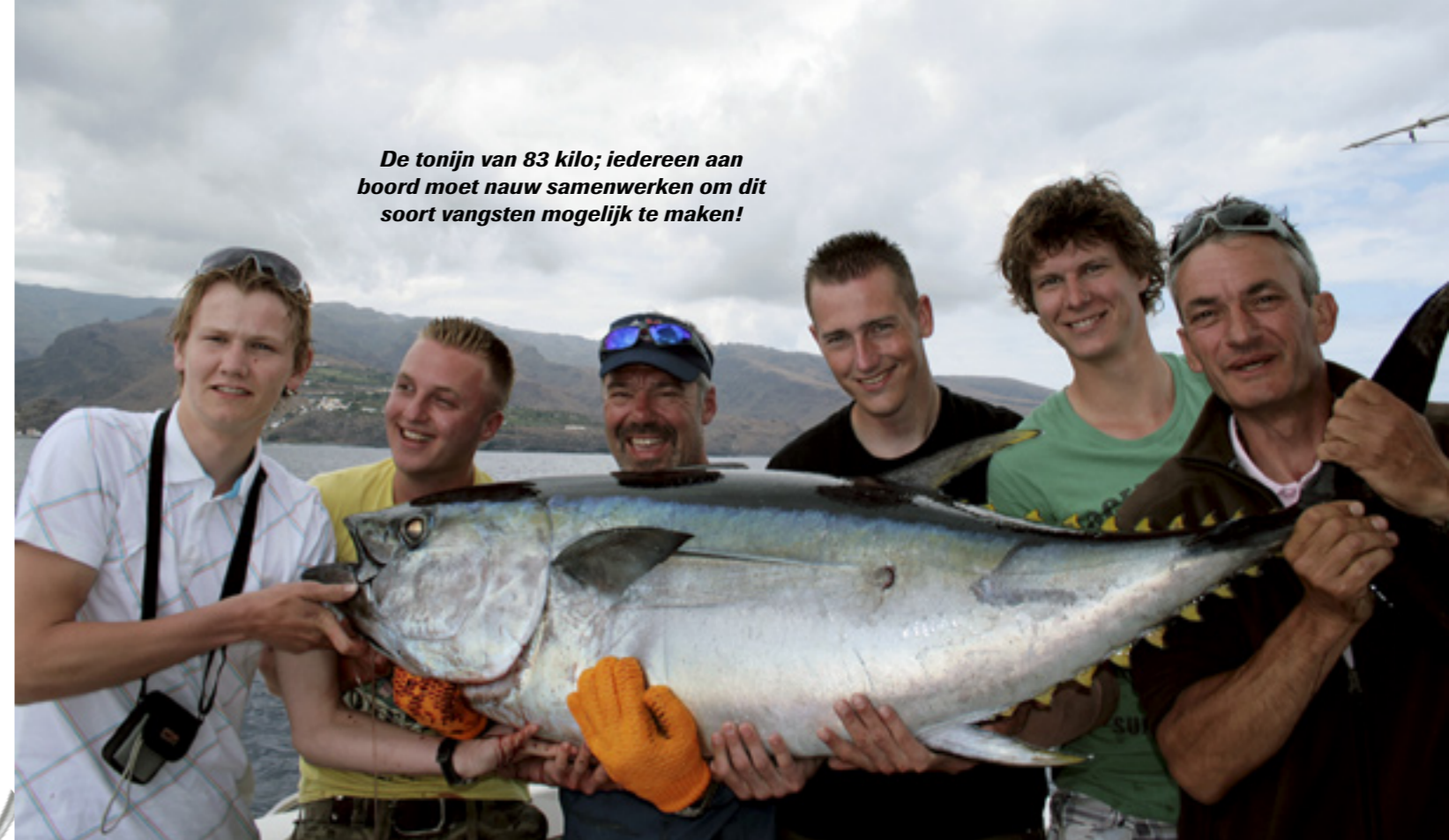
De tonijn van 83 kilo; iedereen aan boord moet nauw samenwerken om dit soort vangsten mogelijk te maken!