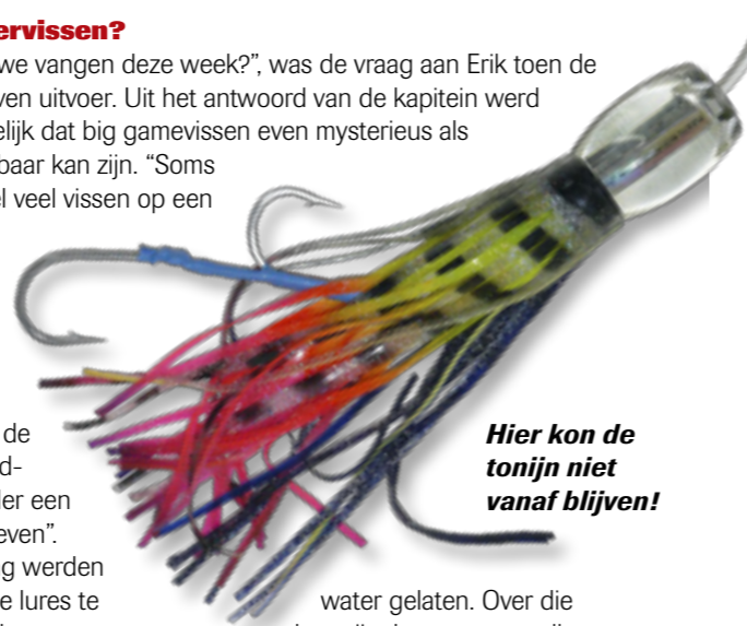
Hier kon de tonijn niet vanaf blijven!

Door het urenlange monotone gebrom van de motor heerst er een complete rust aan boord. Volgens specialisten imiteert het gebrom zelfs een school aasvis! Iedereen tuurt wat voor zich uit, op zoek